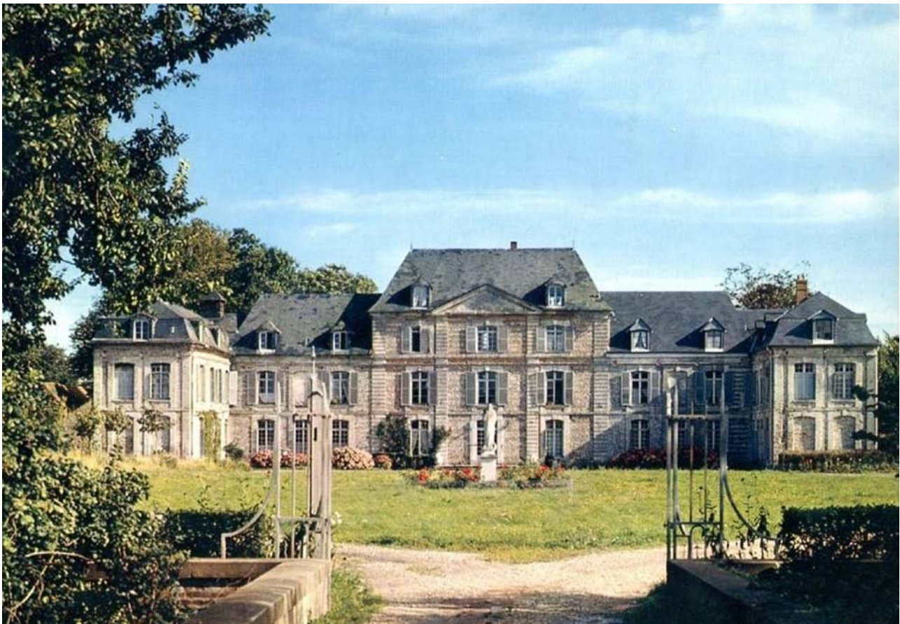
Le château de Thibermont, Normandie

La salle des hommes « contient 24 lits, et ne peut en souffrir plus de 5 ou 6 d'augmentation, en cas de nécessiter » 14 . Cette pièce mesure 55 pieds de longueur par 30 pieds de largeur et 11 de hauteur. De dimensions semblables à celle des hommes, la salle des femmes est percée par huit portes et par autant de fenêtres. Dix lits sont disposés le long des murs.