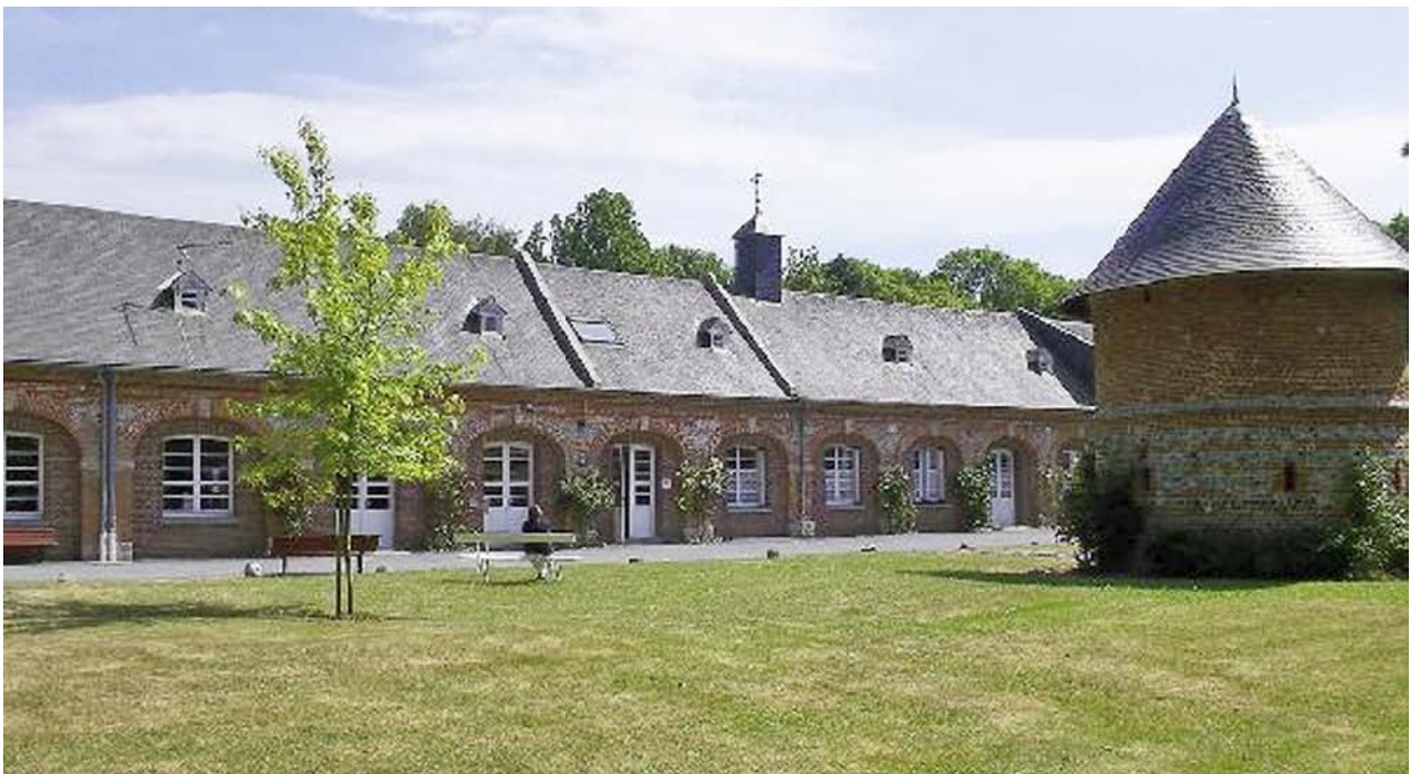
Monastère des Augustines de Thibermont, Normandie

Le travail est divisé entre les sœurs converses et les choristes. Les tâches manuelles sont réservées aux premières tandis que les secondes s'occupent des malades 15 .