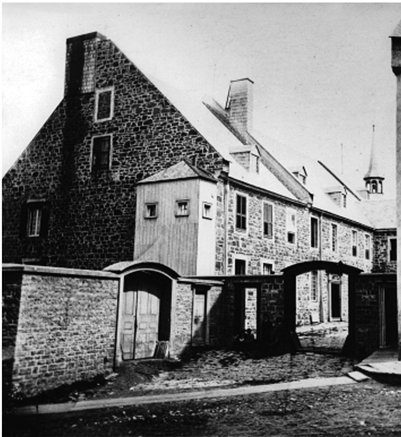
L'Hôtel-Dieu de Québec, vers 1865