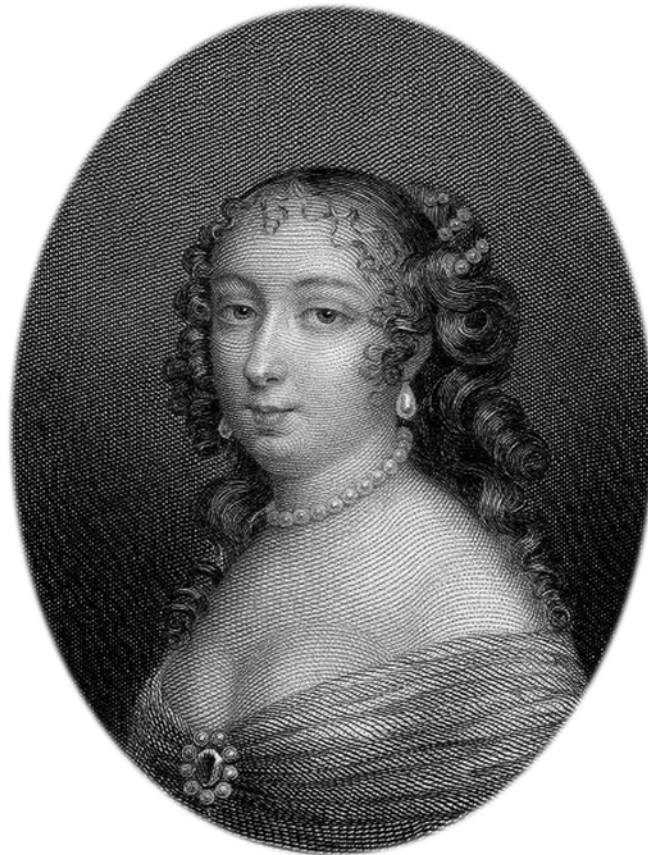
Marie-Madeleine de Vignerot, duchesse d'Aiguillon

En France, les 17 e et 18 e siècles distinguent deux principaux types d'hôpitaux: l'hôpital général et l'Hôtel-Dieu. L'hôpital général, dont la création remonte au milieu du 17 e siècle, est d'abord un lieu d'enfermement des pauvres 1 . Toutefois, devant l'échec de l'entreprise, sa vocation s'élargit pour accueillir une clientèle hétérogène, les plus vulnérables de la société: les infirmes, les vieillards, les épileptiques, les prostituées, les enfants abandonnés et les aliénés. A la fin du 17 e siècle, des hôpitaux généraux sont établis à Québec et à Montréal.