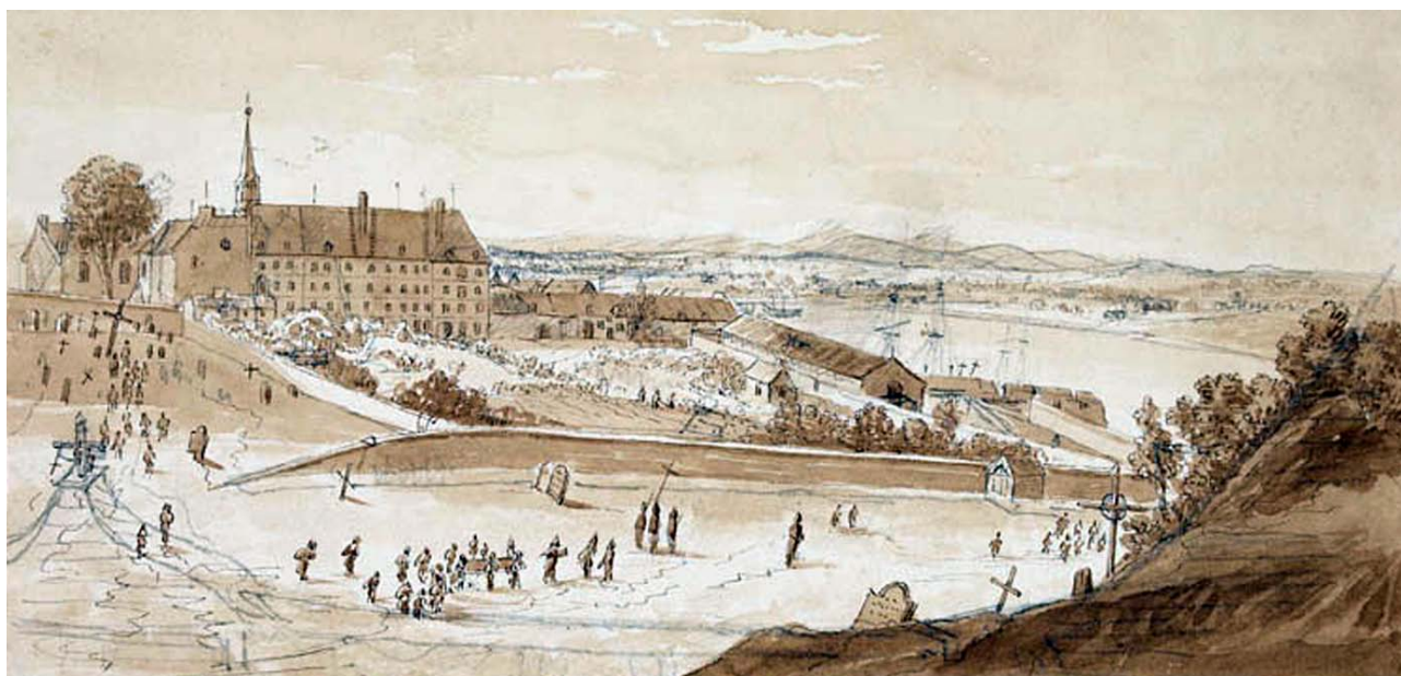
L'Hôtel-Dieu de Québec, vers 1885

Signalons également que plusieurs malades viennent se faire soigner à l'Hôtel-Dieu sans être nécessairement hospitalisés. Selon une religieuse, « Beaucoup de personnes ... venoient a Cet hopital Se faire panser de legeres playes ». De plus, les religieuses fournissaient gratuitement aux pauvres de la ville et de la campagne des médicaments sur ordonnances du médecin ou du chirurgien-major 28 .