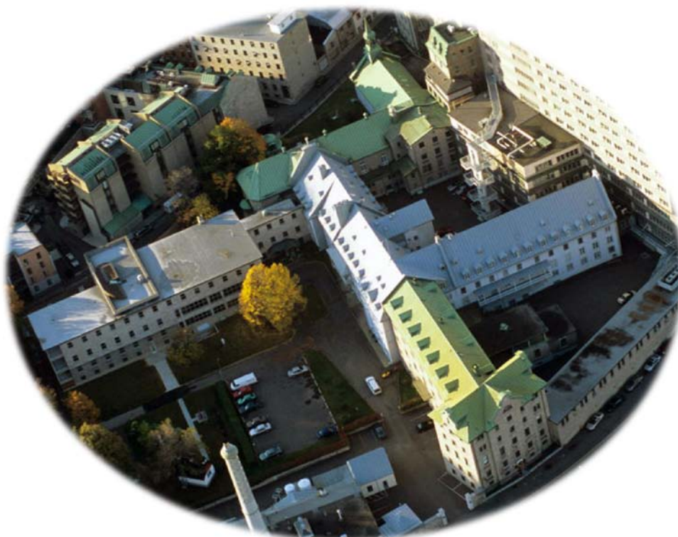
Vue aérienne de l'Hôtel-Dieu de Québec

47. Denis Martin, « Une iconographie hospitalière en Nouvelle-France: étude de quelques tableaux anciens », dans Questions d'art Québécois . Cahier du CELAT, n o 6, février 1987, p. 50.