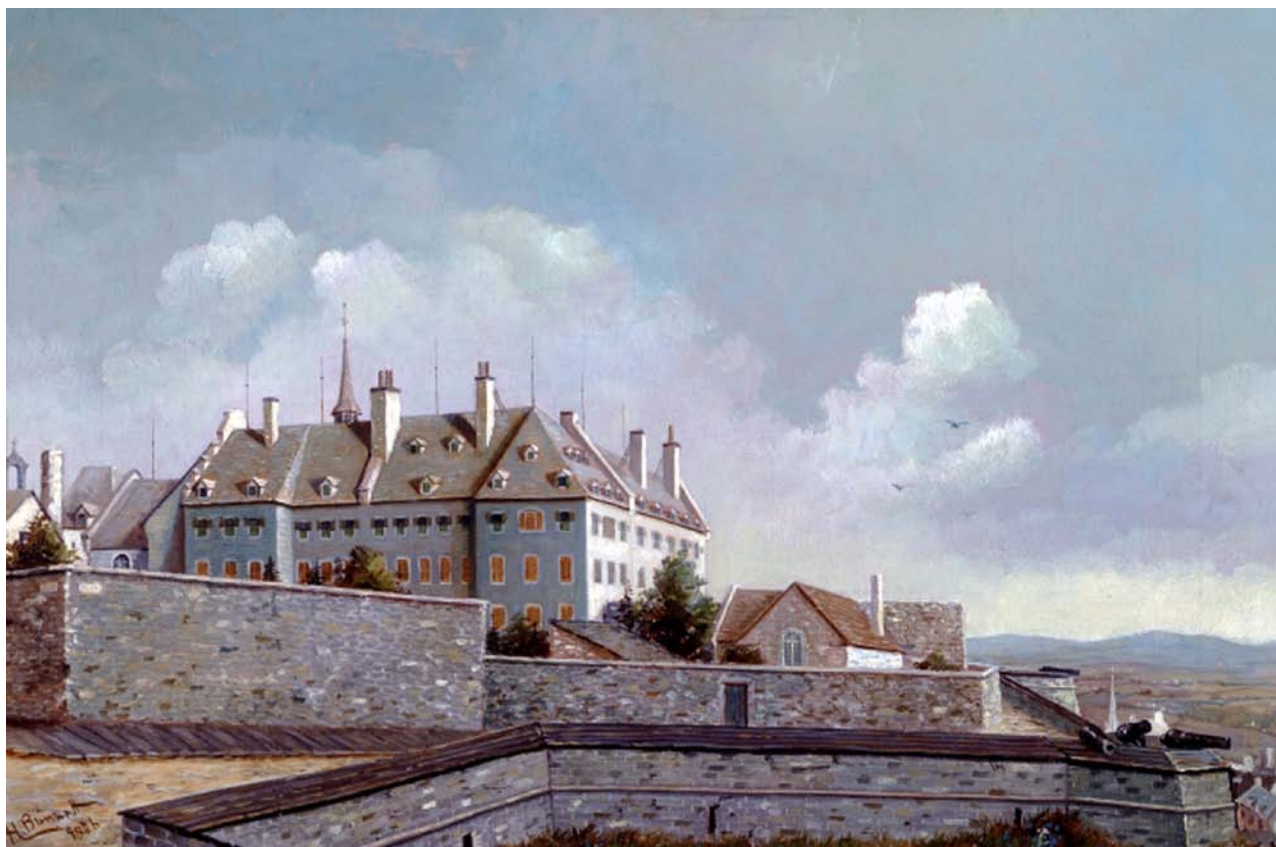
L'Hôtel-Dieu de Québec, vers 1822-1832